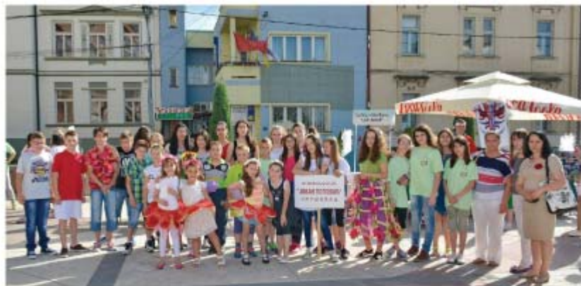
Видовдански еко дан